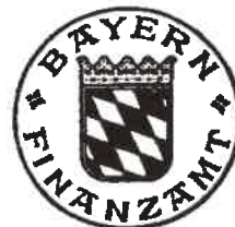
Jäger Vermessungstechnischer Beamter Bodenschätzung